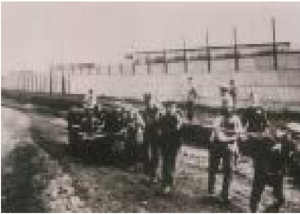
3 - Kommando de prisonniers du camp de Schirmeck