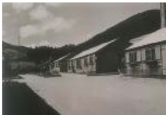
Vue générale de l'intérieur du camp

Pour les nazis, l'Alsace et la Moselle sont des terres allemandes. Dès lors, une politique de germanisation et de nazification est appliquée de fait à ce territoire.