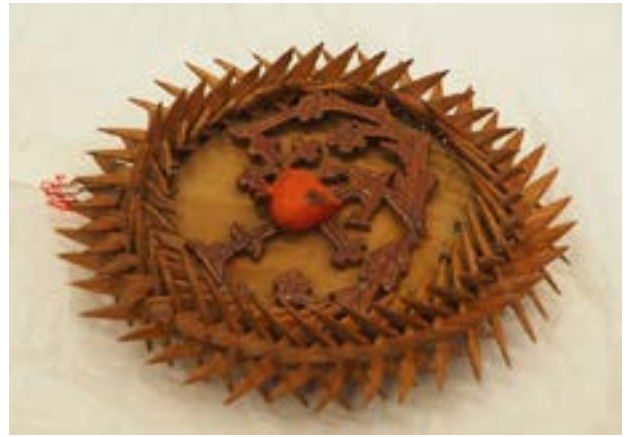
4 - Couronne tressée dans le camp par une détenue