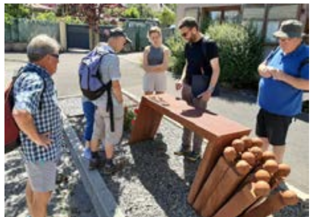
6 - Des visiteurs rassemblés devant la stèle mémorielle située à l'emplacement du camp de sûreté de Vorbruck-Schirmeck

Pour toute demande de visuels, merci de nous contacter par mail à l'adresse suivante : relationspubliques@memorial-alsace-moselle.com