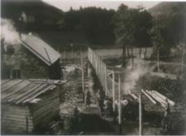
1 - Début de la construction du camp de Schirmeck