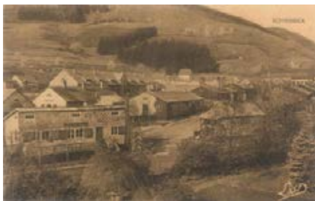
Vue générale du camp de sûreté

- Plus d'informations : www.memorial-alsace-moselle.com