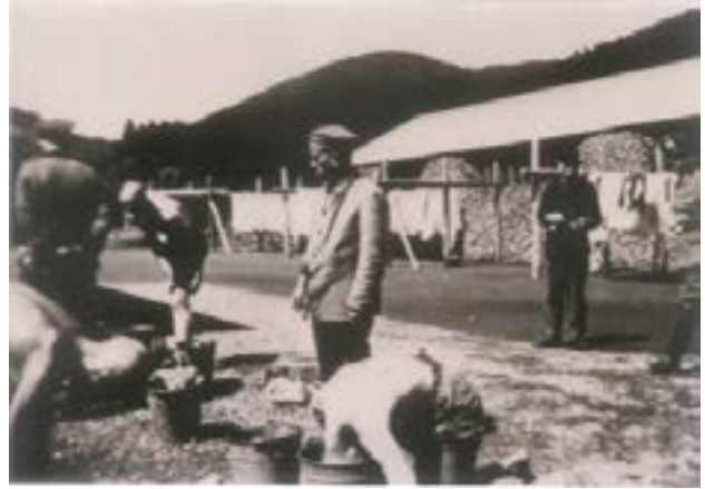
2 - Prisonniers du camp de Schirmeck après la tonte