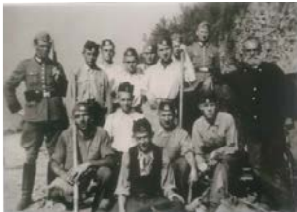
Kommando de prisonniers aux carrières de Hersbach