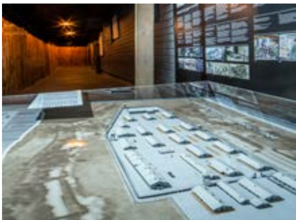
5 - Maquette du camp visible dans l'exposition permanente du Mémorial