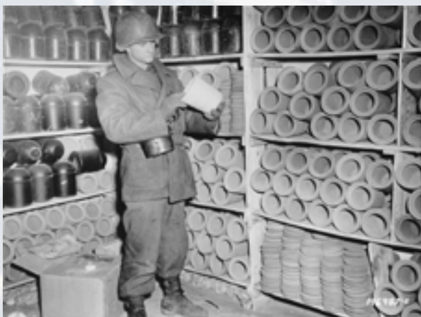
3 - Découverte du camp de concentration de Natzweiler vide, par les troupes américaines accompagnées des FFI, le 25 novembre 1944