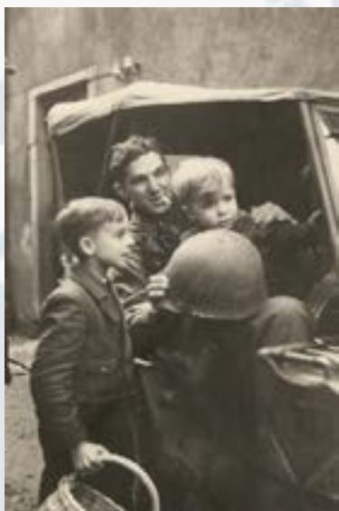
1 - Des enfants en compagnie d'un soldat américain dans les rues de Schirmeck libérée le 25 novembre 1944