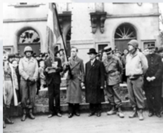
4 - Célébration à Saâles le 26 novembre 1944

Pour toute demande de visuels, merci de contacter Delphine PELLENARD, chargée des relations presse et relations publiques, par mail à l'adresse suivante :