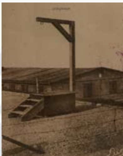
Camp de concentration de Natzweiler

La vallée de la Bruche est également choisie par les autorités nazies pour implanter un camp de concentration. L'emplacement retenu est celui des anciennes pistes de ski au Struthof, sur la commune de Natzwiller ( Natzweiler ), sur le Mont Louise où des gisements de granit rose ont été détectés. Le camp de concentration de Natzweiler ( Konzentrationslager Natzweiler ) est alors mis en service le 1er mai 1941. Quelque 52 000 déportés originaires de l'Europe entière sont envoyés dans ce camp de concentration ou ses annexes au cours des années de guerre.