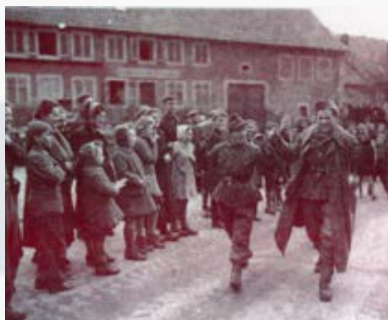
2 - Prisonniers allemands encadrés par l'armée américaine à Lutzelhouse, le 25 novembre 1944.