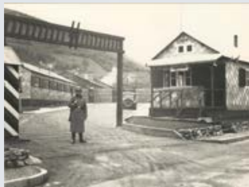
Camp de sûreté de Vorbruck-Schirmeck durant l'annexion de fait

Au coeur du Gross-Schirmeck a été installé un camp de sûreté ( Sicherunslager Vorbruck-Schirmeck ), actif dès l'été 1940. Les autorités nazies l'utilisent comme un moyen de répression efficace et terrifiant pour la population locale. Tout Alsacien réfractaire au régime, homme comme femme, y est interné pour subir une reprogrammation idéologique dans des conditions terribles. Quelque 15 000 personnes y sont envoyées de l'été 1940 jusqu'à novembre 1944.