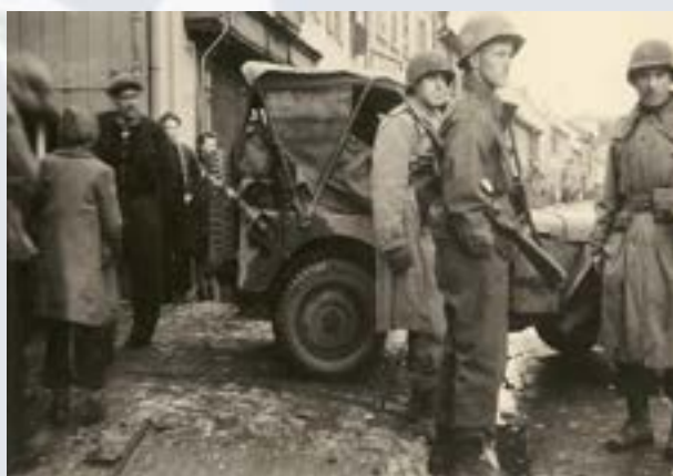
Libération de Schirmeck le 25 novembre 1944.

Après le 26 novembre 1944, les troupes américaines quittent la vallée de la Bruche et sont réorientées vers un autre secteur, en direction de Moyenmoutier, commune des Vosges. Le territoire bruchois est alors placé sous contrôle de l'administration française.